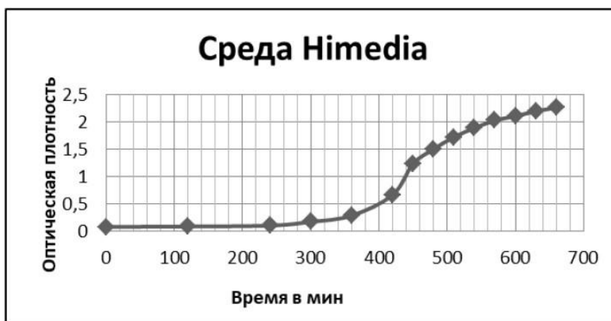
Рисунок 1 – Кривая роста в среде Himedia