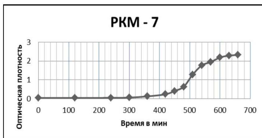
Рисунок 2 – Кривая роста в среде РКМ-7