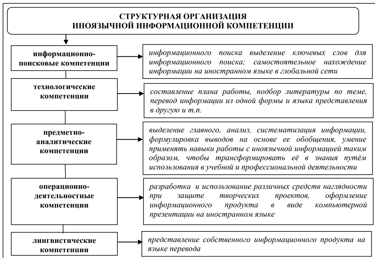
Рисунок 2 – Структурные компоненты иноязычной информационной компетенции

Иноязычная информационная компетенция структурно организована и включает информационно-поисковые, технологические, предметно-аналитические, операционно-деятельностные, лингвистические компетенции. Каждый структурный компонент представлен группой определенных знаний, умений и навыков, реализуемых на практике (рисунок 2).