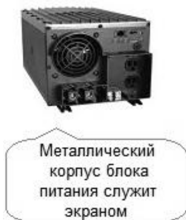
Рисунок 3 – Применение экранов в качестве корпусов преобразователей

Для конструкции корпуса применяются магнитные материалы на металлической основе (железо, сталь и т.д.). В случае использования пластикового корпуса возможно использование специальных проводящих красок для экранирования корпуса. Пример конструкции приведен на рисунке 3.