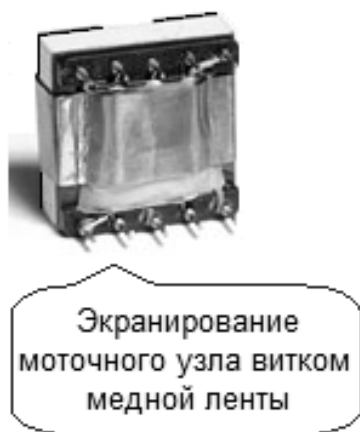
Рисунок 2 – Экранирование отдельных узлов преобразователя

Что касается третьего метода, то есть применения экранов в качестве корпусов преобразователей, то в данном случае корпус преобразователя служит электромагнитным экраном для излучаемого отдельными узлами.