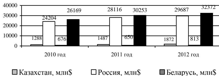
Рисунок 2 - Динамика стоимостного объема фармацевтических рынков ЕЭП в 2010–2012 гг., в $ млн

Динамика стоимостного объема фармацевтических рынков (ЕЭП) Казахстана, России и Беларуси за 2010–2012 гг., в $млн., представлена на рисунке 2.