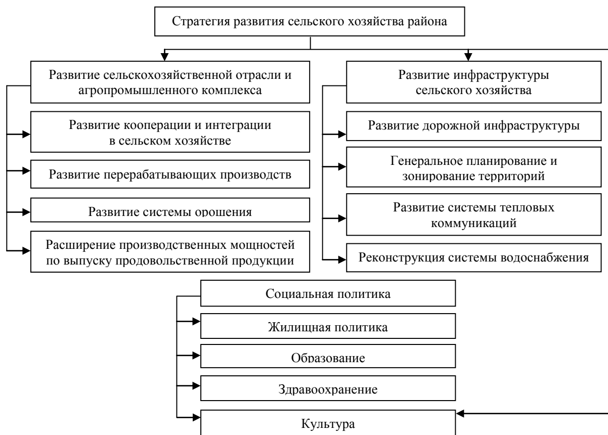
Рисунок 2 – Основные приоритеты стратегии развития сельского хозяйства района

В мировой практике на сельскохозяйственное производство и агропромышленный комплекс оказывает влияние научно-технический прогресс. Последствия воздействия научно-технического прогресса на сельскохозяйственное производство в целом сводятся как к положительным, так и к отрицательным моментам.