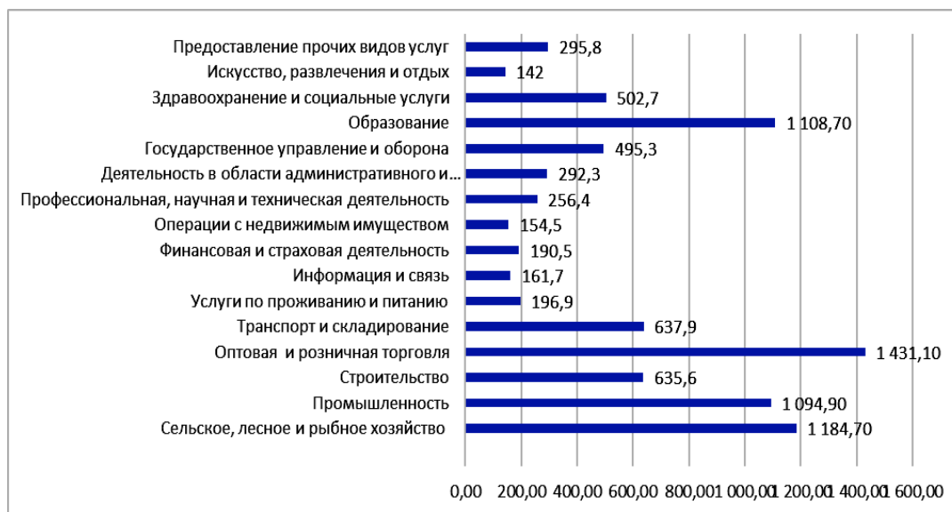
Рисунок 1 – Структура занятого населения по отраслям в 2021 году, тыс. человек

Можно отметить тот факт, что сельское хозяйство и традиционные промышленные производства перестают быть главными секторами экономики, на первое место выходят динамично развивающиеся отрасли сферы услуг. В целом межотраслевой перелив рабочей силы не сопровождался заметным ростом безработицы. Однако ученых беспокоят не столько тенденции в структурных изменениях отраслевой занятости, сколько скорость и социально-экономические последствия этих перемен, которые обусловлены сильным отставанием в развитии индустриального сектора экономики, в особенности, в обрабатывающих отраслях промышленности (рисунок 1) [7].